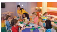
ÁREA DE RECREAÇÃO