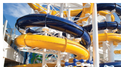
PISCINA E ÁREA ESPORTIVA