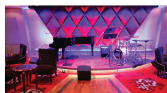
ÁREA DE ENTRETENIMENTO